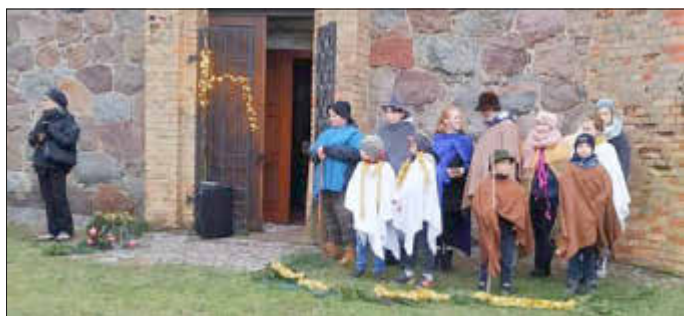
Krippenspiel in Steinmocker 19.12.2021