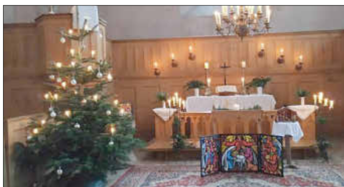
Gottesdienst Heiligabend in Gramzow