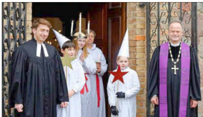
Dorfkirche „Mon Amour“ am 12.12.2021 in Steinmocker