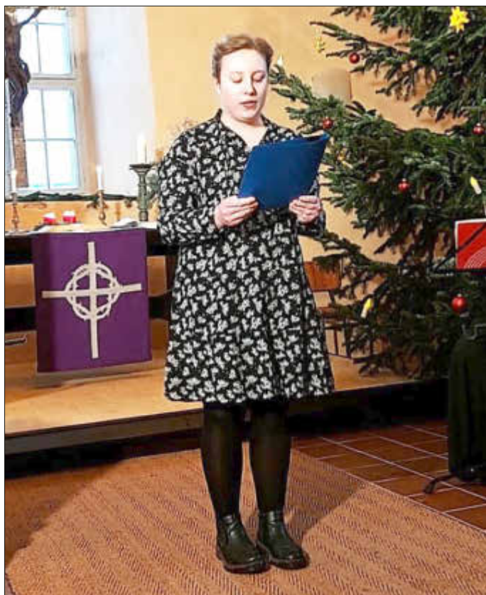
Weihnachtslichterspiel in der Spantekower Vesper