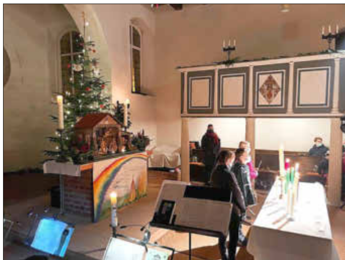
Heilig Abend in Wusseken

Und wieder war alles ganz anders, als wir es gehofft haben. Die Advents- und Weihnachtszeit stellte uns erneut vor große Herausforderungen für alle Veranstaltungen, Konzerte und Gottesdienste. Vieles, was wir in der Hoffnung geplant haben, dass wir wenigstens draußen werden zusammenkommen können (Adventsmarkt mit Musik in Spantekow), mussten wir leider absagen. So gingen wir in den Gottesdiensten an den Adventssonntagen Schritt für Schritt auf das Weihnachtsfest zu.