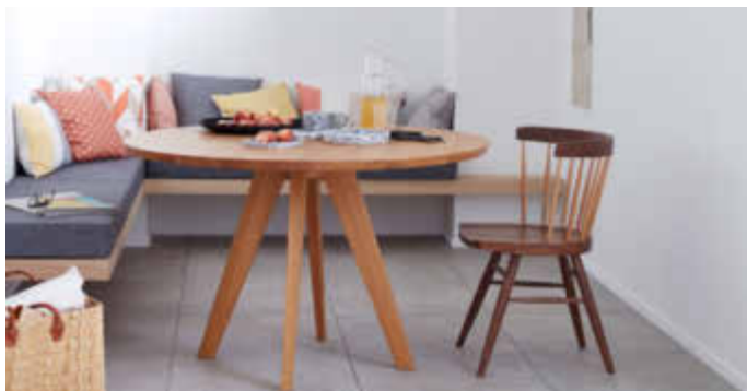
Weiße Wände schaffen eine freundliche Raumatmosphäre, sind aber auch empfindlich für Gebrauchsspuren. Mit Ausbesserungsfarben lassen sich kleine Schäden einfach beseitigen.

(djd). Im Alltag geht schnell etwas daneben und schon bekommt die strahlend weiße Wand einen Fleck oder einen kleinen Kratzer ab. „Die Folgen sind ärgerliche Verfärbungen, die sich jedoch ganz ohne Werkzeug wieder entfernen lassen“, weiß Innenarchitektin und TV-Moderatorin Eva Brenner. Zu diesem Zweck empfiehlt sie Helfer wie die Ausbesserungsprodukte von Polarweiss. „Einfach schütteln, sprühen und schon sind lästige Flecken und Markierungen auf der Wand wieder verschwunden“, erklärt Eva Brenner. Neben der Sprühflasche ist die Ausbesserungsfarbe auch in einer Tube mit Schwamm zum schnellen Auftragen erhältlich. Unter www.schoener-wohnen-farbe.com gibt die Expertin in Videos weitere nützliche Tipps, zu bekommen sind die Helfer im Fachhandel und in zahlreichen Baumärkten.