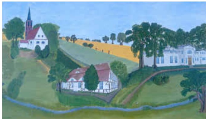
Wandbild Bürgerhaus Butzow