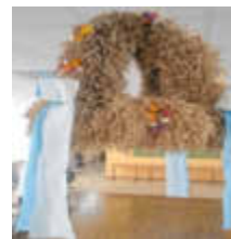
Erntekrone Bürgerhaus Butzow