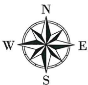
Bebauungsplans Nr. 6 "PV-Anlage Rehberg" der Gemeinde Spantekow Ausgrenzung