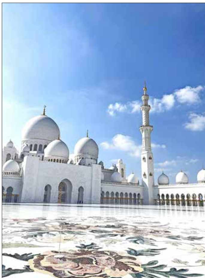
Sheikh-Zayed-Moschee in Abu Dhabi

Winter in Abu Dhabi – 25 Grad Celsius und strahlender Sonnenschein! Woanders auf der Welt gestaltet sich die „kalte“ Jahreszeit ganz anders als bei uns.