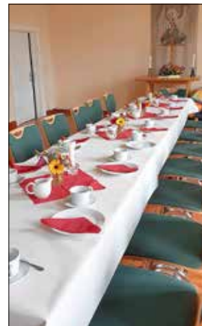
Kaffeetafel am 23.01.24

Das Kirchgeld und die Friedhofssachkosten können Sie dienstags und donnerstags von 9.00 bis 12.00 Uhr im Pfarramt Spante-