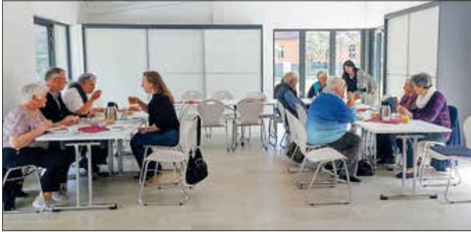
Mittagessen im Blücherhaus in Boldekow

zu feiern. Bei schönstem Sonnenschein fuhren sie von Ort zu Ort und kamen schließlich in Boldekow an, wo nach dem Gottesdienst eine warme Soljanka im Blücherhaus serviert wurde.