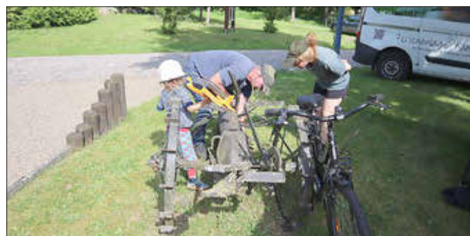
Alte Landtechnik wird erklärt