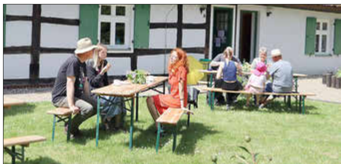
Kaffeepause vor der Museumskate Kagendorf