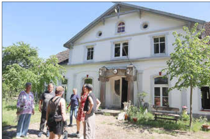
Besuch auf dem Kastanienhof

B 109 entfernt ist, als ruhiges und beschauliches Kleinod. Alles in allem war das Wochenende zu Pfingsten ein schöner Erfolg, obwohl man sich viel mehr Gäste erhofft hätte. Die nächste Veranstaltung ist die Feier zum Kindertag am 6. Juni im Dörphus Kagendorf.