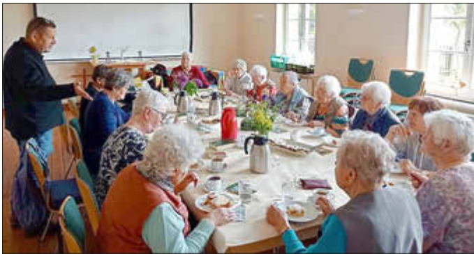
Gemeindenachmittag im Mai in Spantekow