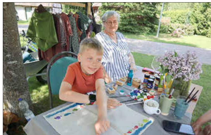
Kartoffeldruck will gelernt sein